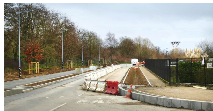
Rue Gay Lussac.

Les aménagements paysagers des noues et les revêtements de trottoirs et chaussées, rue Gay Lussac, ont débuté comme prévu en octobre 2015.