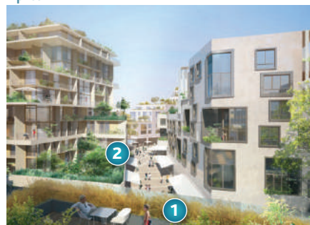
1 Terrasse du bâtiment 1A en construction (à gauche) et perspective (à droite) 2 Terrasse du bâtiment 1C en construction (à gauche) et perspective (à droite)