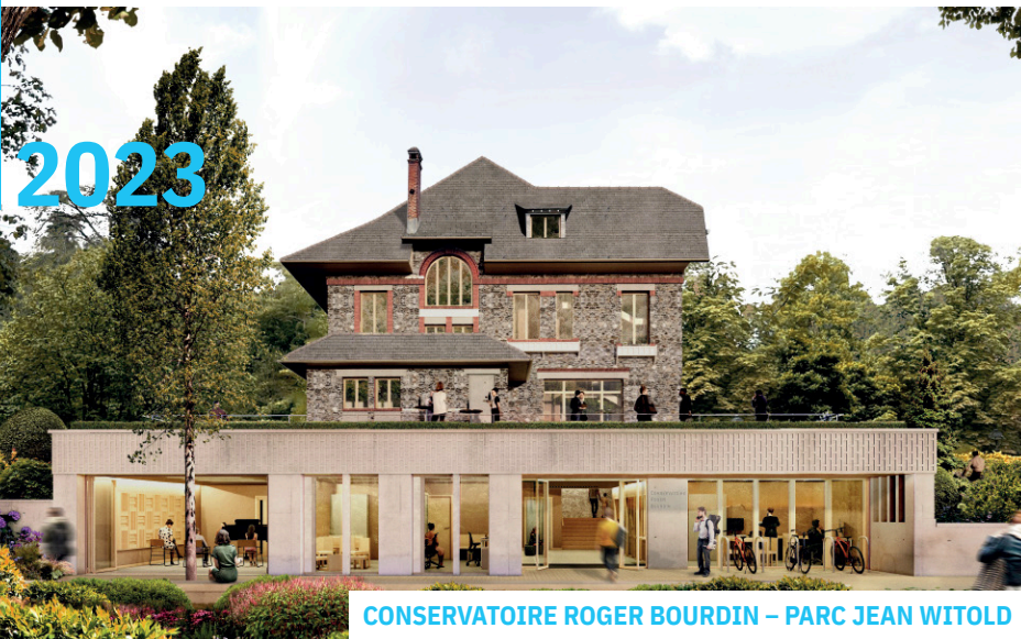
CONSERVATOIRE ROGER BOURDIN – PARC JEAN WITOLD